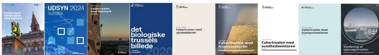
Figur 1: Et uddrag af de seneste års trusselsvurderinger

Trusler kan være aktørdrevne. Dvs. der kan være tale om udenlandske - ofte statslige - aktører, som ønsker at påvirke den danske samfundsorden, f.eks. ved at skabe mistillid til myndighederne eller skabe utryghed i samfundet.