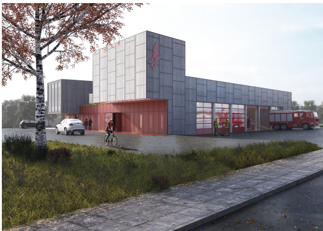
Ny brandstation i Lisbjerg – Station Aarhus Nord