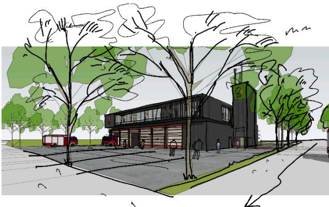
Stationen set fra Søren Nymarks Vej med portene i udrykningsgaragen.

Østjyllands Brandvæsen har på nuværende tidspunkt erhvervet en grund, som efter en del jordbortkørsel, er klar til etablering af en ny brandstation med øjeblikkelig udrykning i Aarhus Syd. Stationen bliver beliggende på Søren Nymarks Vej 6a i Højbjerg.